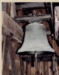
Zvon Panny Marie ze zvonice v areálu kostela Stětí sv. Jana Křtitele