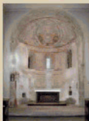
Nástěnné malby v interiéru kostela pocházejí z konce 13. století